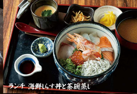
ランチ 海鮮らす丼と茶碗蒸し